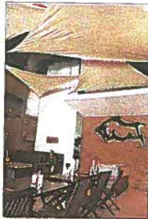
Plaza Futura cuenta con nuevos restaurantes, como Torritos Grill

"Es un proyecto de primer mundo, que está cambiando la faz de la zona, es un ícono... vamos a la vanguardia y lo hemos terminado en una época difícil (de crisis en el sector construcción)"