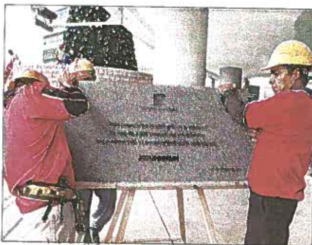
Agrisal colocará una placa de reconocimiento a los dos mil 500 trabajadores que construyeron Torre Futura

En términos de cifras, la obra rompe con los esquemas y todos los estándares arquitectónicos y corporativos: empleó a más de dos mil 500 salvadoreños, contrató a 500 proveedores en el proceso de construcción y hasta la fecha ha colocado un 75% de las oficinas de Torre Futura, y en un 100% los de la Plaza.