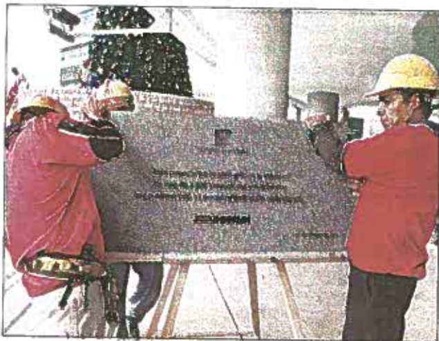
Agrisal colocará una placa de reconocimiento a los dos mil 500 trabajadores que construyeron Torre Futura

En términos de cifras, la obra rompe con los esquemas y todos los estándares arquitectónicos y corporativos: empleó a más de dos mil 500 salvadoreños, contrató a 500 proveedores en el proceso de construcción y hasta la fecha ha colocado un 75% de las oficinas de Torre Futura, y en un 100% los de la Plaza.