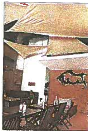
Plaza Futura cuenta con nuevos restaurantes, como Torritos Grill

"Es un proyecto de primer mundo, que está cambiando la faz de la zona, es un ícono... vamos a la vanguardia y lo hemos terminado en una época difícil (de crisis en el sector construcción)"